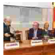
Manifestazione soci emeriti Accademia Peloritana