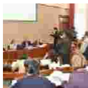
Bilancio 2010 in pareggio e ricerca di soluzioni innovative