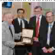
IV Conferenza CIMS