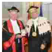
Lectio magistralis del prof. Brotchi