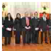
Premiazione Borse di Studio "Carrozza Pollicino"